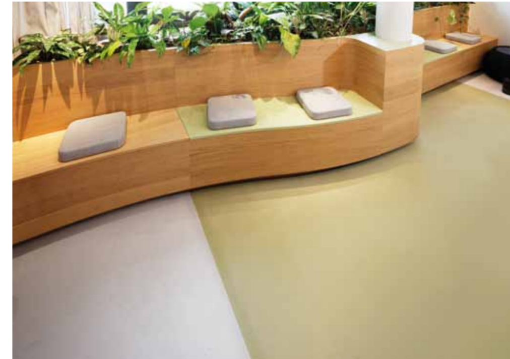
Pandomo® Floor: edel und vielseitig

„Insbesondere die zweifarbige Pandomo-Beschichtung in grün/grau ist eine handwerkliche Herausforderung, aber auch ein gestalterisches Highlight. Bei diesem speziellen Projekt setzt sich die Farbigkeit in den Sitzmöbeln fort. Auch solche außergewöhnlichen Wünsche setzen wir bei Betec um. Gerne beraten wir Sie zum Thema Bodenbeschichtung.“