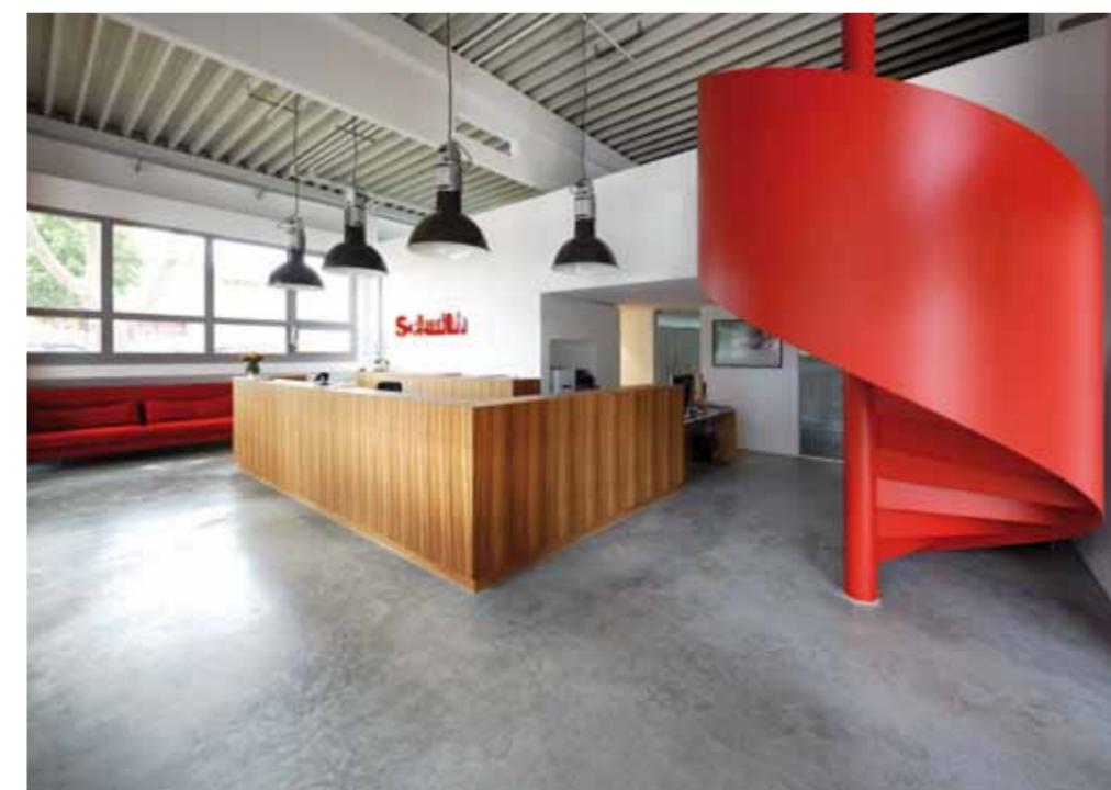
Sichtestrich: robust und lebendig

Eine PU-Beschichtung ist elastisch und schalldämmend und damit bestens für Sanierungen geeignet. Die poren- und fugenlose Oberfläche verleiht jedem Raum eine edle und großzügige Erscheinung. Das warme Gehgefühl sorgt für ein Komfort-Plus, das viele Privatkunden besonders schätzen. Außerdem ist eine PU-Beschichtung leicht zu reinigen. Zur Wahl steht eine umfangreiche Farbpalette und durch die manuelle Verarbeitung ist jeder Boden ein Unikat.