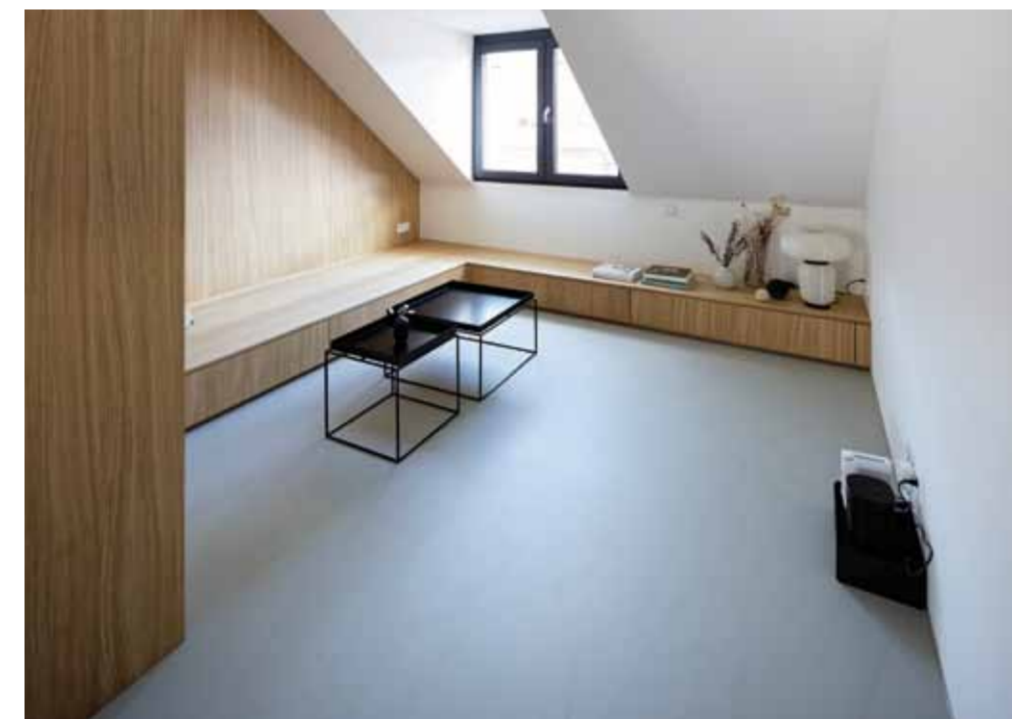
PU-Beschichtung: warm und elastisch

Für alle, die das Besondere schätzen. Pandomo Floor ist ein individueller, zementärer Bodenbelag mit hoher Oberflächenfestigkeit. Auch große Flächen lassen sich schnell und wirtschaftlich realisieren – vor allem für höher frequentierte Bereiche wie Lobbys oder Shops, die unter Termindruck modernisiert werden müssen, macht sich Pandomo schnell bezahlt. Aber auch viele unserer Privatkunden schätzen Pandomo als individuelle und immer einzigartige Bodenbeschichtung, die dem Alltag trotzt und dabei immer hervorragend aussieht.